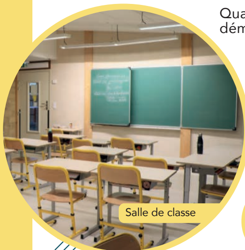
Salle de classe

Quatre classes, deux ateliers et une salle d'activité construite dans une démarche de Haute Qualité Environnementale.