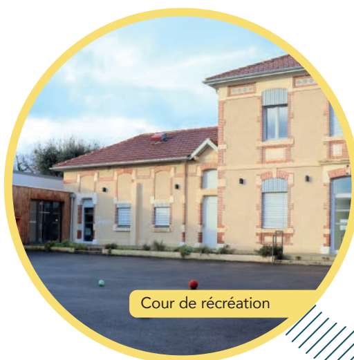
Cour de récréation

4 enseignants, 4 AESH et une équipe de 7 agents intercommunaux professionnels de l'enfance œuvrent chaque jour pour accompagner les enfants dans leurs différents apprentissages.