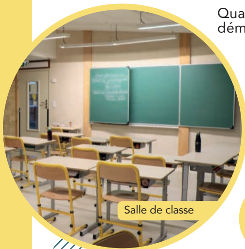
Salle de classe

Quatre classes, deux ateliers et une salle d'activité construite dans une démarche de Haute Qualité Environnementale.