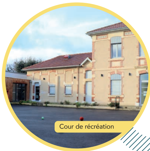
Cour de récréation

4 enseignants, 4 AESH et une équipe de 7 agents intercommunaux professionnels de l'enfance œuvrent chaque jour pour accompagner les enfants dans leurs différents apprentissages.