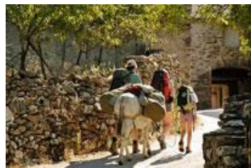
Création et promotion de produits touristiques (randonnées, hébergement, restauration, visites, ...)