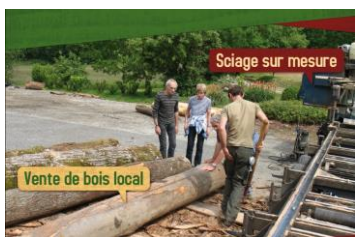
Valorisation de la forêt et création d'une filière