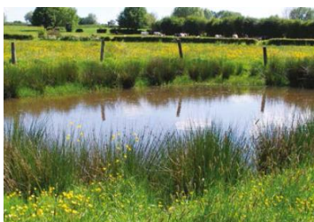
Appui aux pratiques agro-écologiques, restauration de mares, maintien de l'élevage, plantation de haies