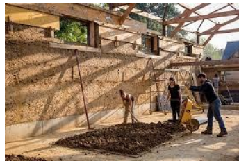
Renforcement de l'artisanat et promotion des techniques de rénovation du bâti