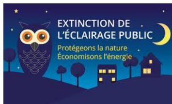
Amélioration de la qualité du ciel nocturne, développement du tourisme, économies d'énergie