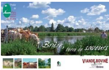
Création d'une filière locale de viande « du Parc »

Les 53 Parc naturels régionaux français regorgent de projets intéressants. Voici quelques exemples :