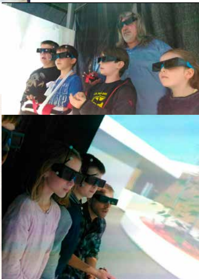
Les enfants de Saint Michel dans le Cube 4 D à la découverte de leur future école.

Près de 400 participants ont découvert grandeur nature le vaste projet scolaire dont la fin des travaux est prévue au mois de janvier 2020.